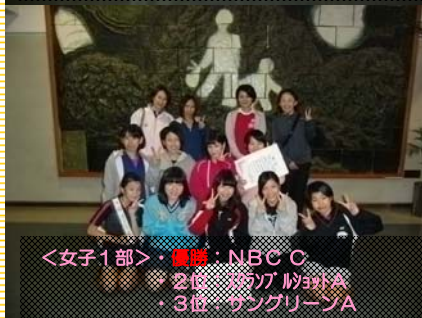
<女子1部>・優勝：NBC C ・2位：スラブショット A ・3位：サングリーン A