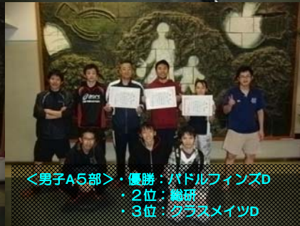
<男子A5部>・優勝：パドルフィンズ D ・2位：職研 ・3位：ガラスメイツ D