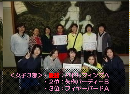
<女子3部>・優勝：パドルフィンズ A ・2位：矢作パーティー B ・3位：ファイヤード A