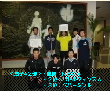
<男子A2部>・優勝：NBC A ・2位：パドルフィンズ A ・3位：ペパーミント