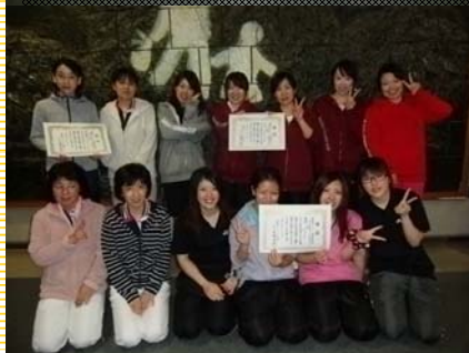
<女子4部>・優勝：スラブショット B ・2位：サングリーン C ・3位：矢作パーティー C