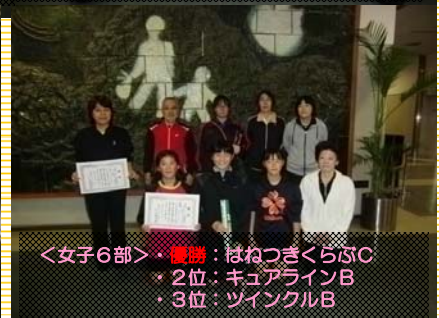
<女子6部>・優勝：はねつきくらぶ C ・2位：キュアライン B ・3位：ツインクル B