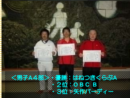
<男子A4部>・優勝：はねつきくらぶA ・2位：OBC B ・3位：矢作パーティー