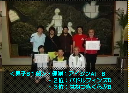
<男子B1部>・優勝：アイシンAI B ・2位：パドルフィンズ D ・3位：はねつきくらぶ B