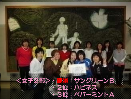
<女子2部>・優勝：サングリーン B ・2位：ハビネス ・3位：ペパーミント A