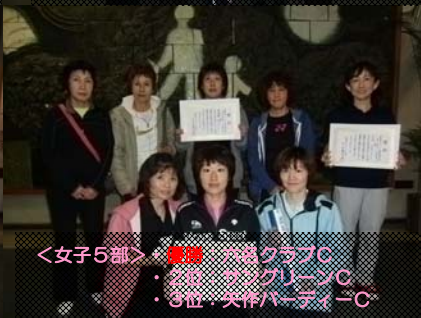
<女子5部>・優勝：スラブショット C ・2位：サングリーン C ・3位：矢作パーティー C